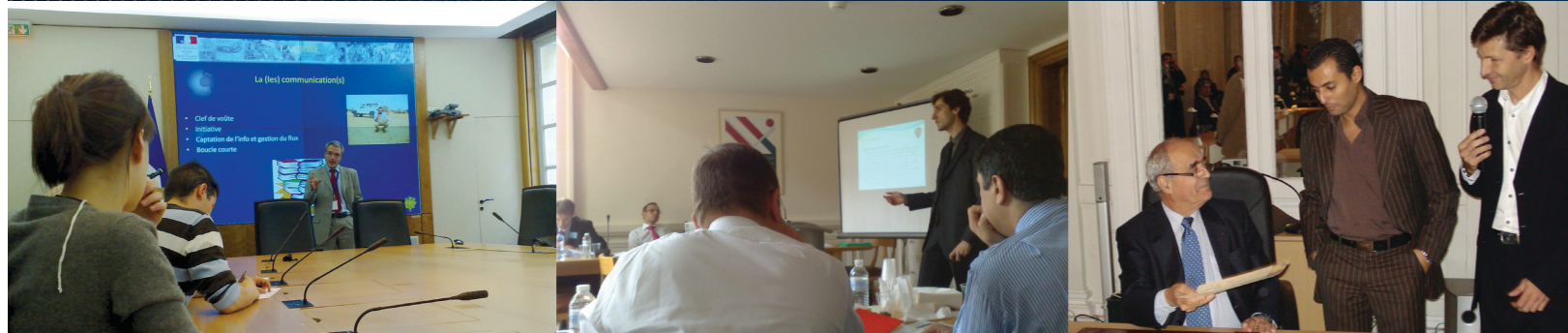
La pédagogie partagée entre cours, exercices pratiques & interventions de spécialistes